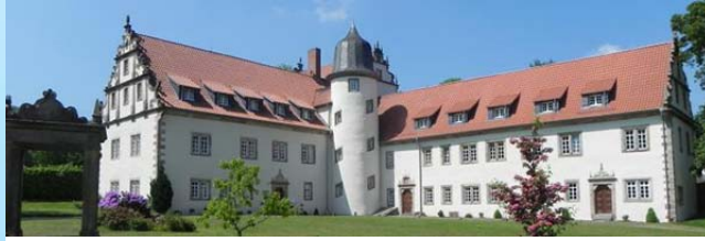
Das Schloss Buchenau